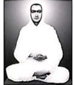
இராமலிங்க அடிகள் (1823 - 1874)

'வாடிய பயிரைக் கண்டபோதெல்லாம் வாடினேன்' என்னும் வலுவான ஒற்றை வரி நம்முள் அழுத்தமாகப் பதிகிறது. இது, திகட்டாத தெள்ளுதமிழ் திருவருட்பா தந்த வள்ளலாரின் கூற்று. அவர் அமைதி, அன்பு வழியிலான சமூகத்தை உருவாக்க விரும்பினார்; கடவுள் என்பது ஒன்றே என்றார்; சாதி, மத, இன, பால் வேறுபாடுகள் கடந்த அருள்பெருஞ்சோதி ஒன்றே இறைவன் என்பதை வலியுறுத்தினார். ஏழு வயதிலேயே கவிபாடும் வல்லமை பெற்றுத் தெய்வமணிமாலை, கந்தர் சரவணாபித்து ஆகிய நூல்களை உருவாக்கியவர் வள்ளலார். மறு முறை கண்ட வாசகம் என்னும் உரைநடை நூலை நமக்கு நல்கியவர்; ஒழிவில் ஓடுக்கம், தொண்டை மண்டல சதகம், சிம்மய தீபிகை ஆகிய நூல்களைப் பதிப்பித்தவர் வள்ளலார். அவர் அனைத்து உயிர்களிடத்திலும் அன்பு பாராட்டிச் சமரச சக்தி சன்மார்க்க சத்திய சங்கத்தைத் தோற்றுவித்தார்; சத்திய தருமச் சாலையைத் தொடங்கினார். தெய்வங்கள் பல எனச் சொல்லும் உருவ வழிபாட்டை மறுத்தார். பசிமின்றி அனைத்து உயிர்களும் இன்பமுடன் வாழ வலியுறுத்திய வள்ளலாரின் சில கொள்கைகள் பின்வருமாறு: