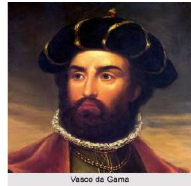
Vasco da Gama

நன்னம்பிக்கை முனையை கடந்து மே-27 கி.பி. 1498 ஆம் ஆண்டு இந்தியாவின் மேற்கு கடற்கரையில்